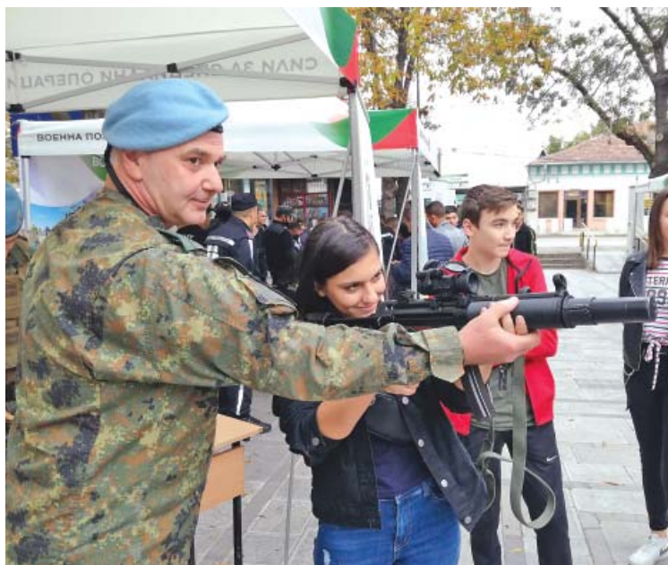
Още в ученическа възраст младите хора трябва да бъдат запалени за служба в армията