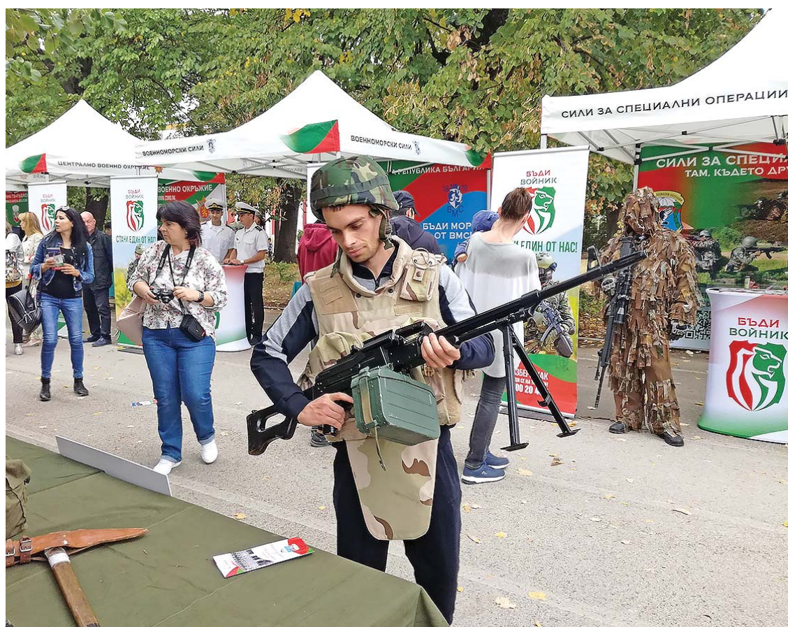
Когато можеш да пипнеш оръжието, а не само да го гледаш на картинка, нещата са галеч по-истински

– Надявам се през новата година успешно да успеем да начертаем новите планове с още по-големи цели и възможности за тяхното реализиране с целия екип от военното окръжие.