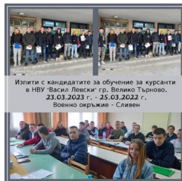
Изпити с кандидатите за обучение за курсанти в НВУ „Васил Левски“ гр. Велико Търново. 23.03.2023 г. - 25.03.2023 г. Военно окръжие - Сливен

В периода 22-24.03.2023 г., в административната сграда на Военно окръжие II степен – Сливен, бяха организирани и проведени изнесени изпити с кандидатите за обучение за курсанти в НВУ „Васил Левски“ – Велико Търново, за учебната 2023/2024 г.